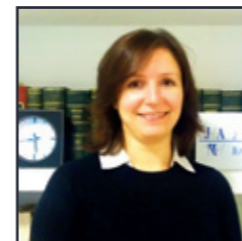
POR MILAGROS PALAO HERRERA Responsable Departamento de Derecho Penal

En los últimos días, no se han dejado de comentar y, publicar diversas opiniones sobre este caso, de candente actualidad e interés para todos los ciudadanos.